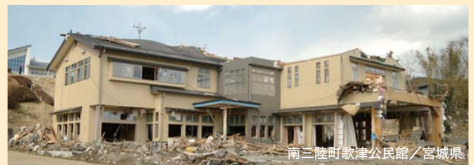
南三陸町歌津公民館/宮城県

この度の東日本大震災において、被害を受けられた地域の皆様に心よりお見舞い申し上げます。一日も早い復興をお祈りしております。 南三陸町歌津公民館は、建物の高さを大幅に超える15m以上の津波が襲いました。周囲の建物が津波にのまれた中、歌津公民館だけがしっかりと残っています。木の構造体には被害がなく、津波に耐えた木造施設としてメディアにも数多く取り上げられました。 耐震性の要求がより一層高まる中、特許構法「KES構法」が注目を集めています。