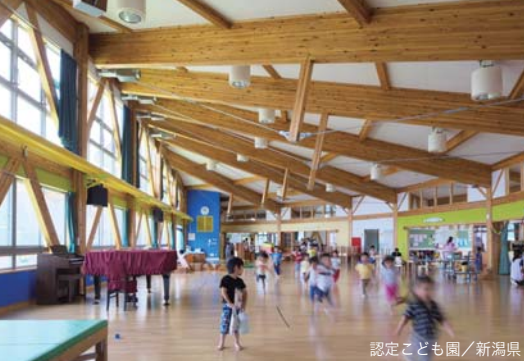
認定こども園／新潟県